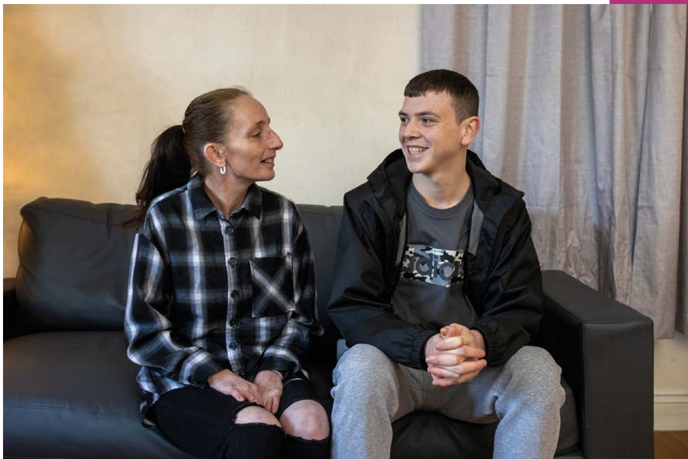
Centre sur l'impact du sans-abrisme

Les expériences des personnes autistes en matière de sans-abrisme montrent également que le refus des services sociaux, les obstacles administratifs et les difficultés rencontrées pour accéder à un logement social ont parfois eu un impact plus important sur leur santé mentale que d'autres facteurs 16 .